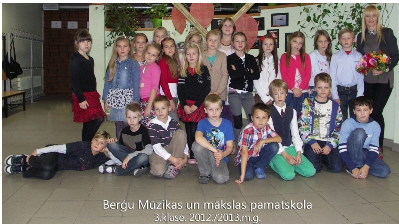
Berģu Mūzikas un mākslas pamatskola 3.klase. 2012./2013.m.g.

2013. gada martā sagatavoja 3. klases kolektīvs