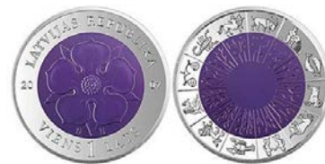
Laika monēta II

Pirmā zāle bija ar dažādām jubilejas monētām, kuras varējām aplūkot arī tuvāk. Mani vairāk uzrunāja Laika monēta. Pabijām vēstures zālē, kur mēs apskatījām, kādas monētas ir bijušas atrastas Latvijā – gan mūsdienās, gan senākos laikos. Visinteresantākā, manuprāt, bija zāle, kur pati varēju visu izmēģināt, apskatīt un aptaustīt. Tur bija spēles, naudas zīmes, dažādu kredītkaršu veidi. Ekskursijas beigās bija dažas filmiņas, lai iepazīstinātu ar dažādiem jēdzieniem, piemēram, inflācija. Arī tas bija interesanti. Kopumā ekskursija bija interesanta un izglītojoša, man patika!